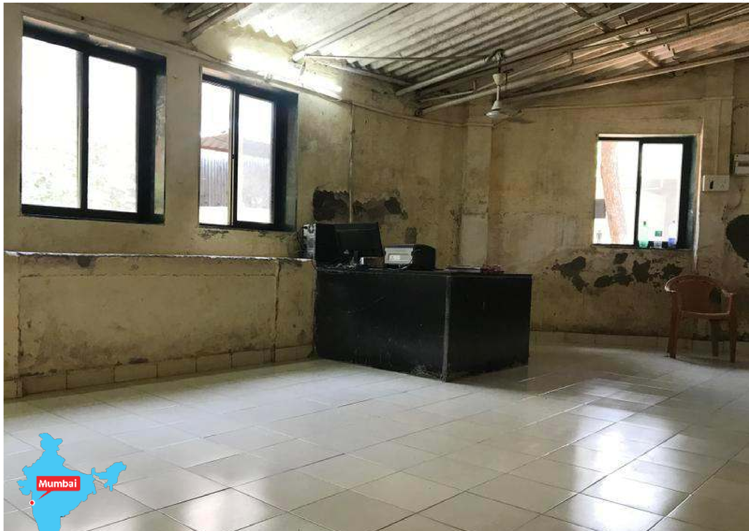
Jo Bycullan vankilan ilmoittautumishuone paljastaa, kuinka huonossa kunnossa ovat vankilan rakennukset.

Samaan aikaan srilankalaisnainen piilotti toisen aikakauslehden väliin lentol-