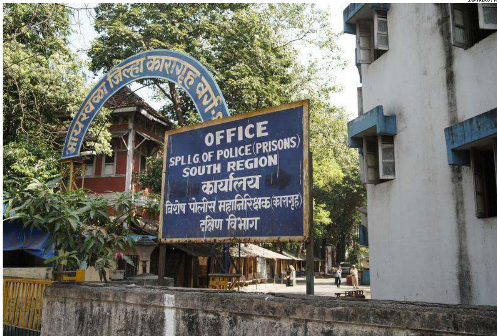
Käynti vankila-alueelle on suoraan vilkkaalta kadulta. Vankilan päärakennus on kuvan ulkopuolella.