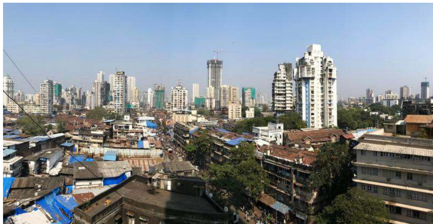
Bycullan vankila on keskellä Mumbaiin jättiläsmetropolia. Vankila-alue on etummaisen tornitalon edustalla.